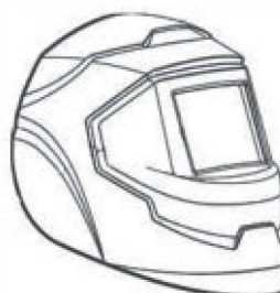
TRUE COLOUR FILTER